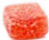
GELATINA DI FRUTTA GUSTO FRAGOLA ARTISANAL FRUIT JELLIES - STRAWBERRY