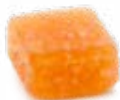
GELATINA DI FRUTTA GUSTO ARANCIA ARTISANAL FRUIT JELLIES - ORANGE