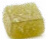
GELATINA DI FRUTTA GUSTO MELA VERDE ARTISANAL FRUIT JELLIES - GREEN APPLE