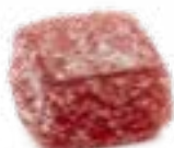
GELATINA DI FRUTTA GUSTO FRUTTI DI BOSCO ARTISANAL FRUIT JELLIES - BERRIES