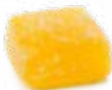
GELATINA DI FRUTTA GUSTO LIMONE ARTISANAL FRUIT JELLIES - LEMON